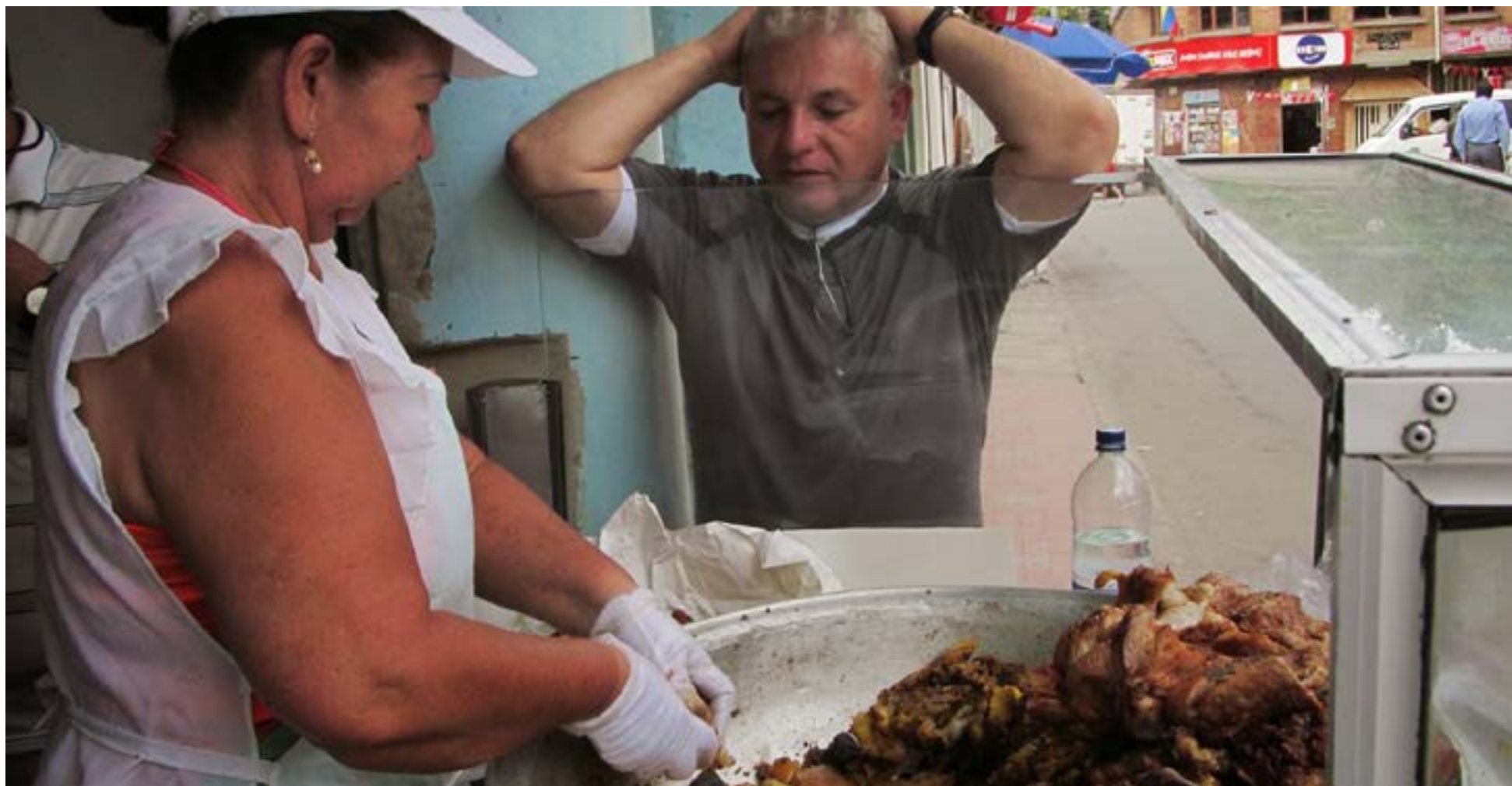
El apetito de los camioneros es grande.