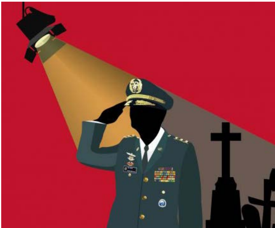
La Jurisdicción Especial para la Paz (JEP) ha sacudido al país con una revelación impactante: 42 antiguos miembros de la IV Brigada del Ejército Nacional, incluyendo seis tenientes coroneles, 23 oficiales, ocho suboficiales.