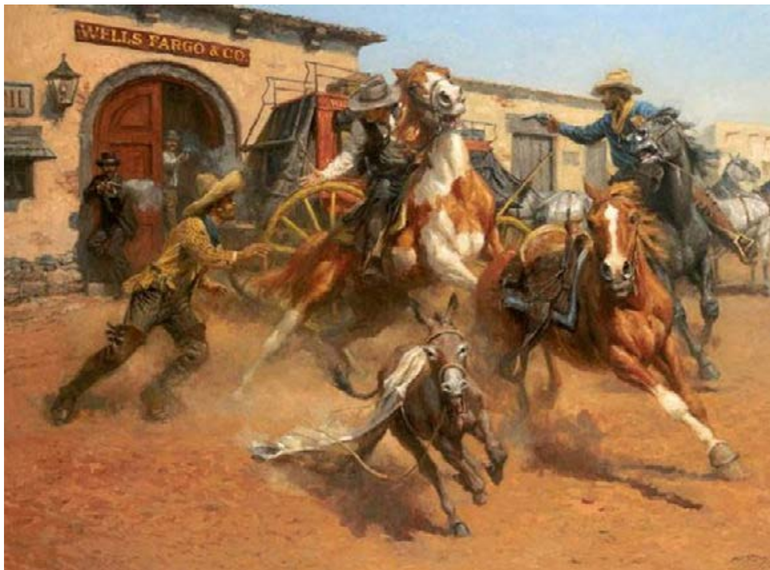
La polarización en Colombia nos ha llevado en una violencia cotidiana alarmante, manifestada incluso en la irresponsabilidad de disparar desde los hogares sin calibrar el riesgo letal para la población inocente, incluidos los niños.

En este complejo panorama, la reciente arremetida contra las estructuras del narcotráfico ha tenido un efecto colateral inesperado: ha afectado a un sector que, velada o abiertamente, ha impulsado el libre tráfico de armas. Esto plantea una inquietante pregunta: si ya hoy, con la prohibición de porte de armas, la violencia es una constante, ¿qué escenario aguardaría a Colombia si se llegara a aprobar una