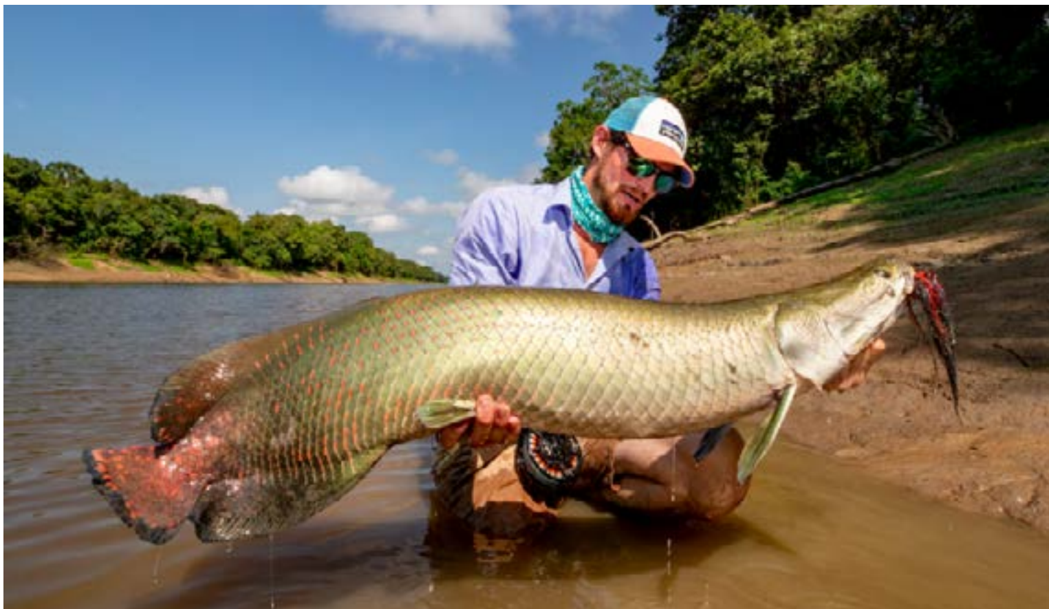
Pirarucú, Pescado blanco de la Amazonía, considerado el pez más grande de agua dulce.

El pirarucú viene a ser el cerdo del río: todo se aprovecha. Desde la carne, blanca, firme y con pocas espinas, hasta las escamas, entre rojizas y amarillentas, que acaban convertidas en abalorios o limas para uñas.