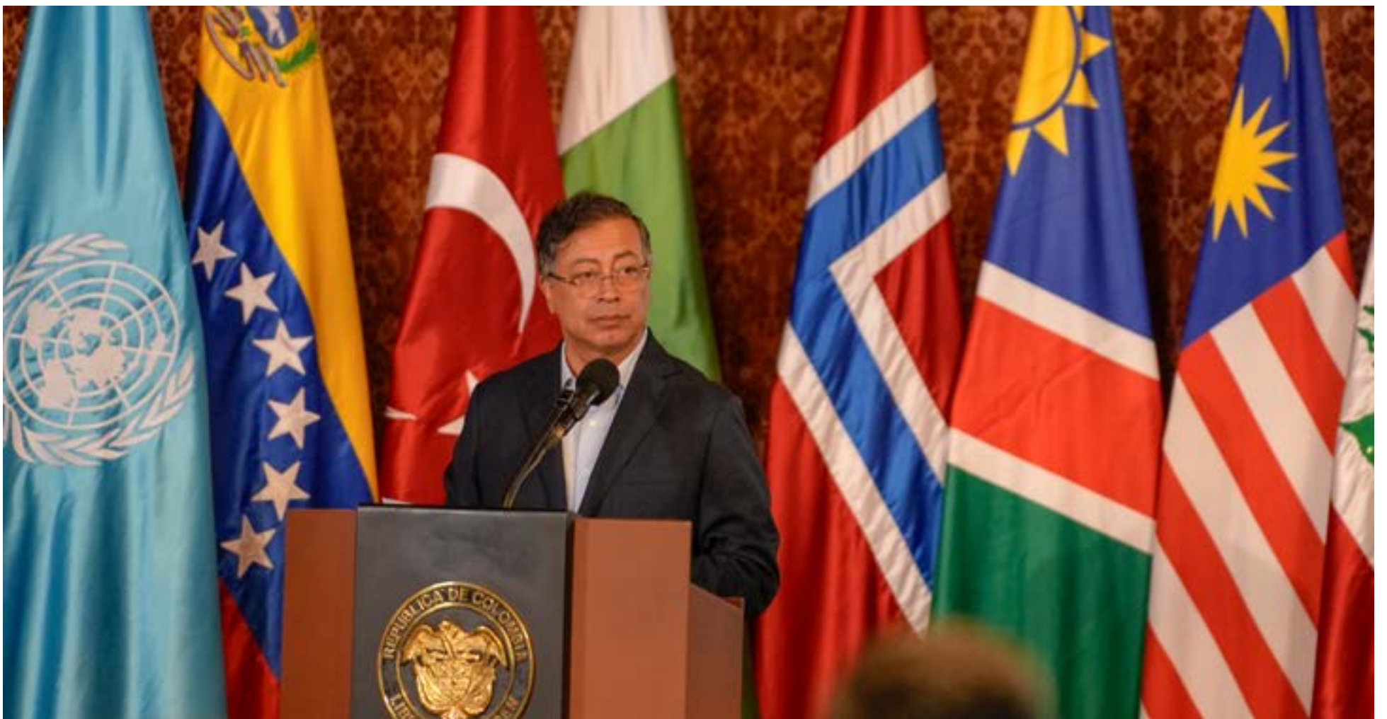
Gustavo Petro Urrego, Presidente de la República de Colombia