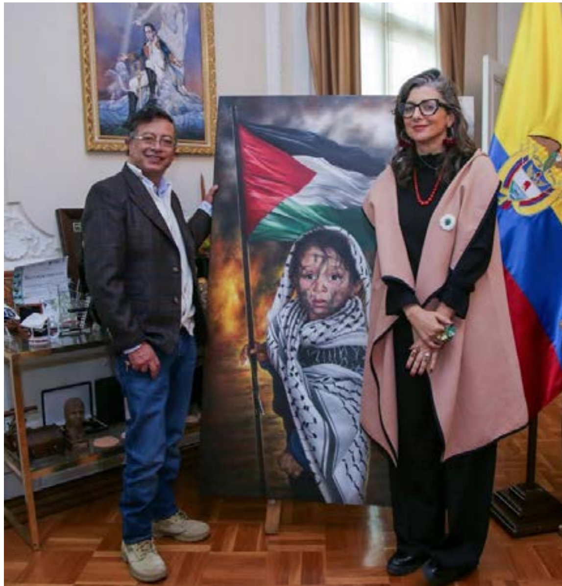
En Colombia, el presidente Gustavo Petro y la relatora de la ONU participaron en una Conferencia Ministerial de Emergencia sobre Palestina. En el evento, Petro propuso la salida de Colombia de la OTAN y acusó a su Ministro de Defensa de traición por la entrada de armamento israelí al país, calificando las acciones en Gaza como genocidio.

«Estoy viendo la alocución presidencial. Me da rubor como periodista que el presidente Gustavo Petro reclama con insistencia a los medios por dar informaciones mentirosas sobre el tema de la situación financiera de las EPS. El llamado del jefe del Estado debe llevarnos a los periodistas a una autocrítica sobre la manera en que estamos informando a los colombianos. Ni censura ni autocensura, pero si equilibrio y mesura. Con esto No traiciono a mis colegas ni creo que sea una herejía pedir autoreflexión. Deberíamos hacerla pronto ¿Pero