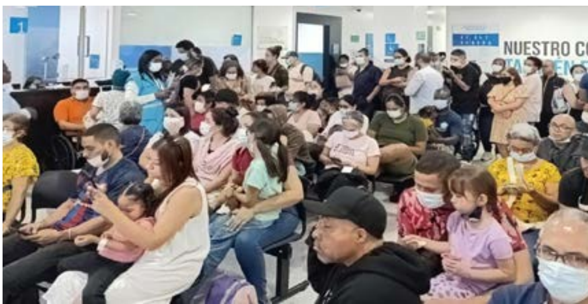
Las EPS colapsaron en Colombia, sacaron el dinero a paraísos fiscales

De hecho, durante esta administración, los recursos destinados al aseguramiento en salud han experimentado un crecimiento cercano al 40%. En 2024,